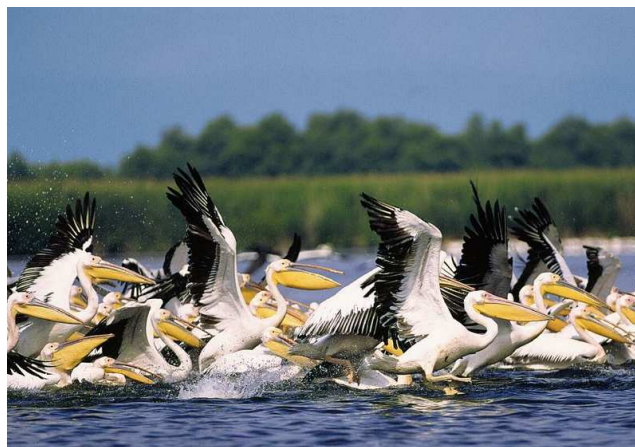
Pélicans Auteur : Goliath