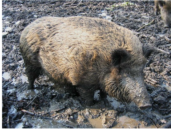
Sanglier dans la boue Auteur : GerardM