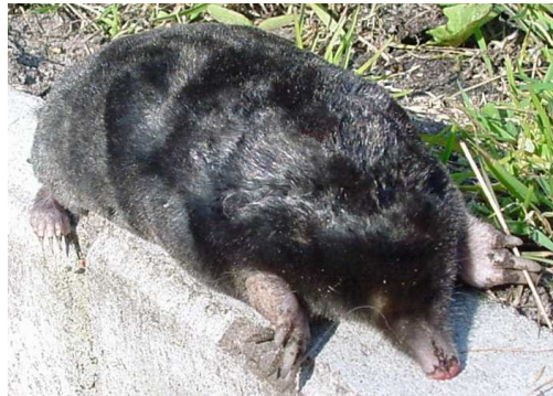
Taupe Auteur : Zoph