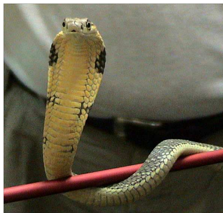
Cobra royal Auteur : Dawson