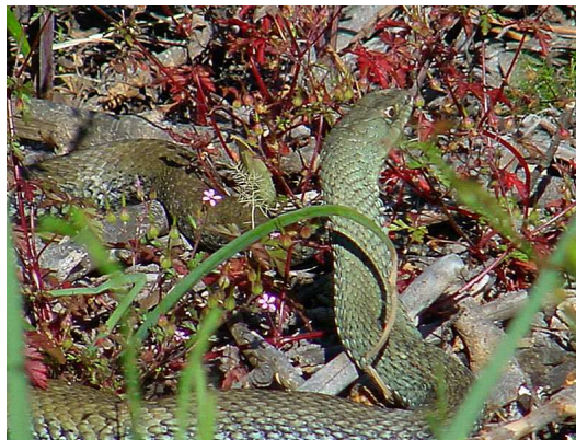
Couleuvre Auteur : Hubert Laroche