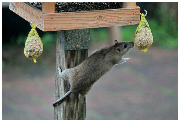
Rat cherchant à se nourrir Auteur : Losch

Note : le rat peut transmettre de nombreuses maladies graves à l'homme par les morsures mais aussi en contaminant les cultures.