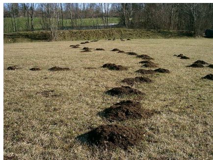
Taupinières Auteur : Pra