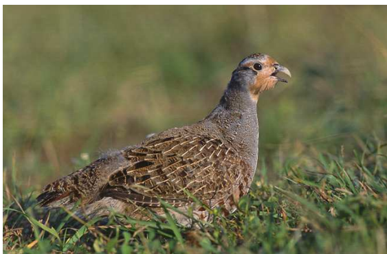
Perdrix grise Auteur : Marek_Szczepanek