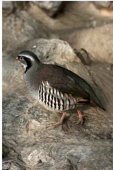
Perdrix bartavelle Auteur : Richard Bartz