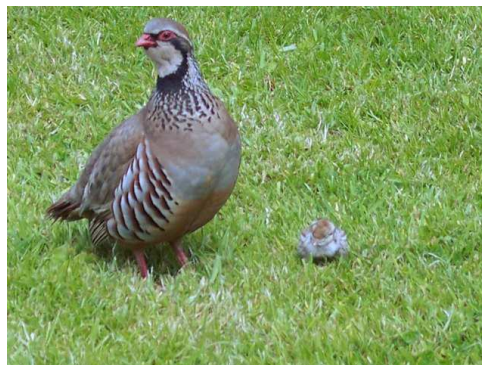
Perdrix rouge Auteur : Trish Steel