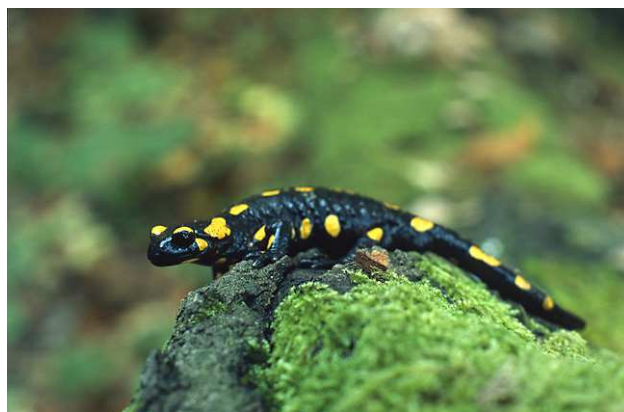
Salamandre Auteur : Marek_Szczepanek