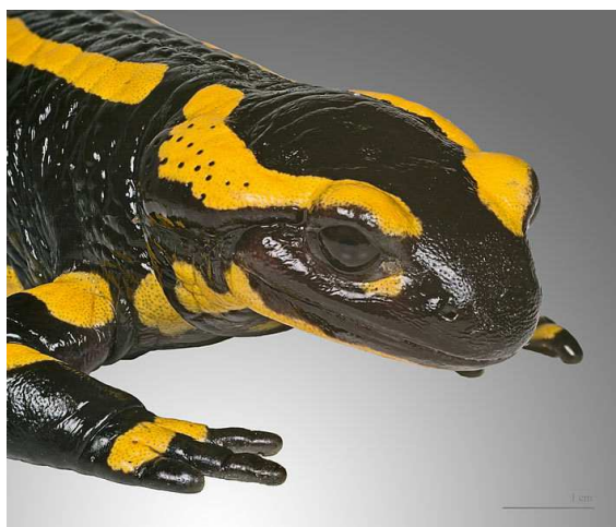
Tête de salamandre montrant la glande parotide Auteur : Didier Descoins