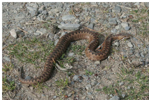
Vipère aspic Auteur : Laurent Lebois