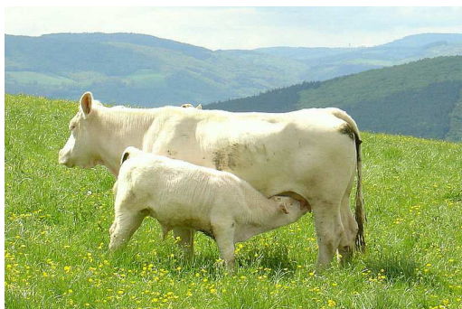
Vache et son veau