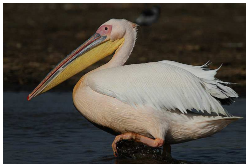
Pélican blanc