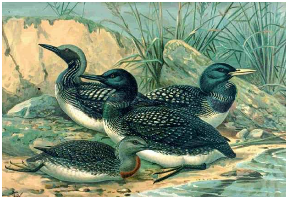
De l'avant vers l'arrière : plongeur catmarin plongeur huard plongeur arctique plongeur à bec blanc