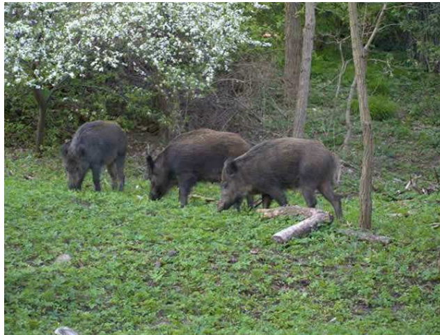
Sangliers dans la forêt