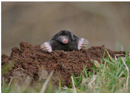
Taupe sortant de sa taupinière Auteur : Dieder Plu