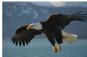
Aigle de mer en vol Auteur : Carl Chapman