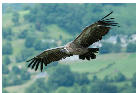
Vautour en vol