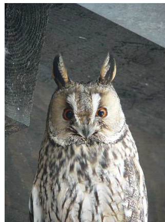
Hibou Auteur : BS Thurner Hof