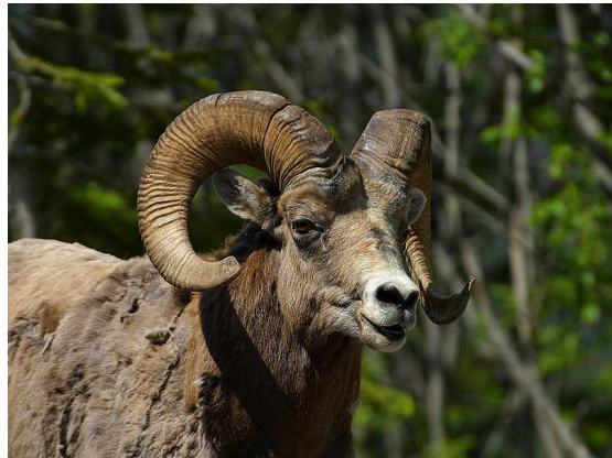
Tête de mouflon