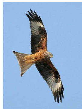
Milan royal Auteur : Thomas Kraft