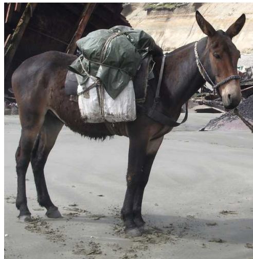
Mulet de bât