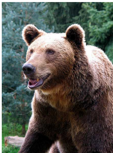
Ours brun Auteur : Jean-Noël Lafargue