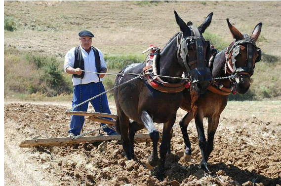
Mulets Auteur : Valdavia