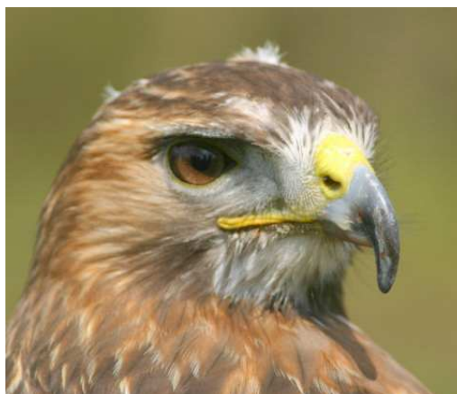
Tête d'aigle Auteur :Peter van der Sluijs