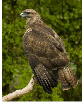
Buse variable Auteur : Spencer Wright