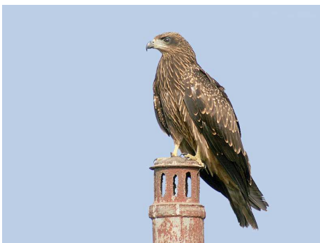
Milan noir Auteur : J.M. Garg