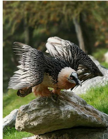
Gypaète barbu Auteur : Richard Bartz