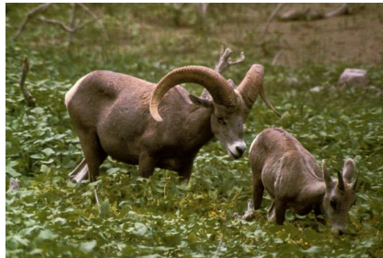
Mouflon et son petit