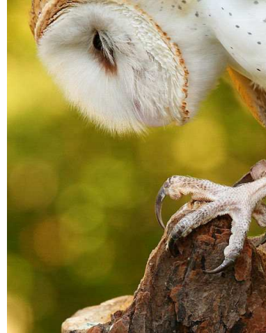
Détails patte et griffes du hibou