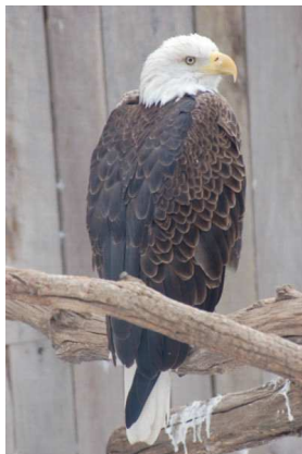
Orfraie pygargue tête blanche