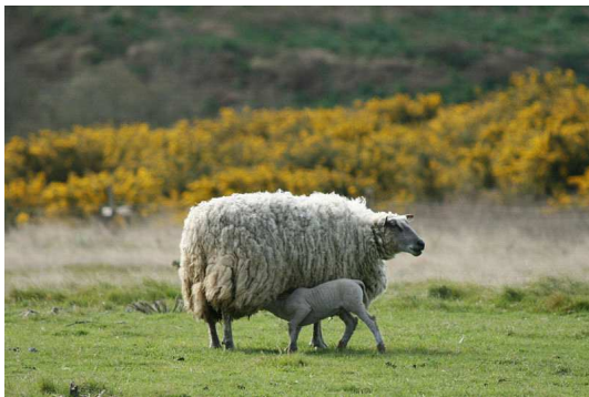
Brebis et son agneau