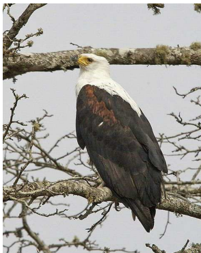
Aigle de mer Auteur : Lip Kee Yap