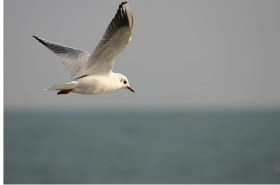
Mouette en vol Auteur : Tristan Nitot