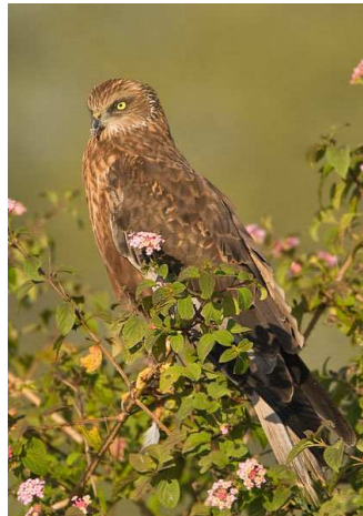
Busard des roseaux Auteur : Subramanya CK