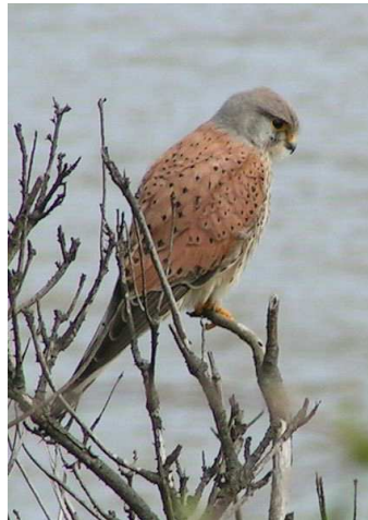
Faucon crécerelle Auteur : Sannse