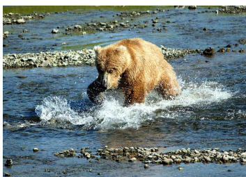
Ours brun Auteur : Carl Chapman