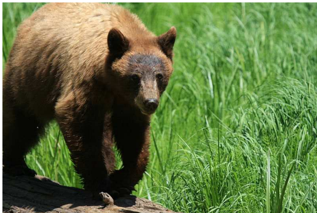
Ours brun Auteur :Wingchi Poon