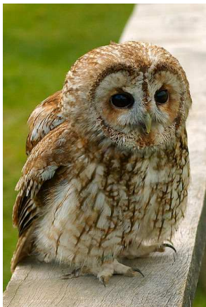
Chouette hulotte Auteur : K.M. Hansche