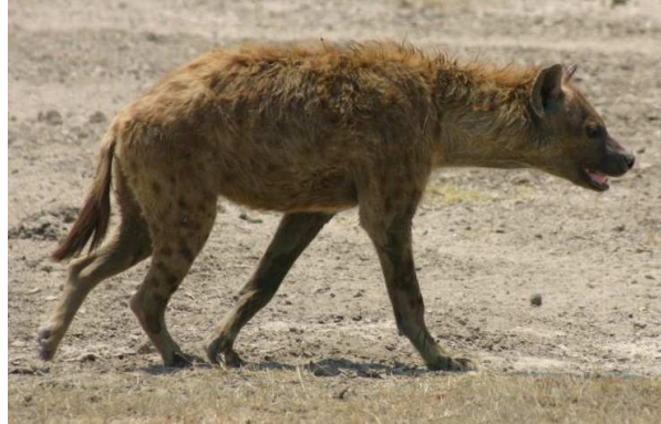
Hyène Auteur : HaJo S