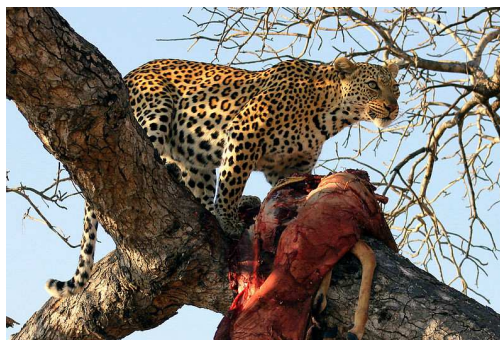
Léopard et sa proie