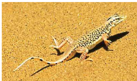
Lézard des sables