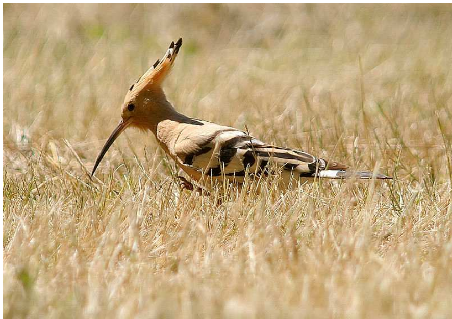
Huppe Auteur : Luc Viatour