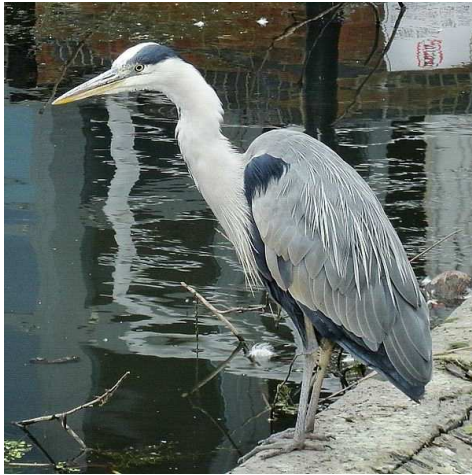
Héron cendré Auteur : Lukasz_Lukasik