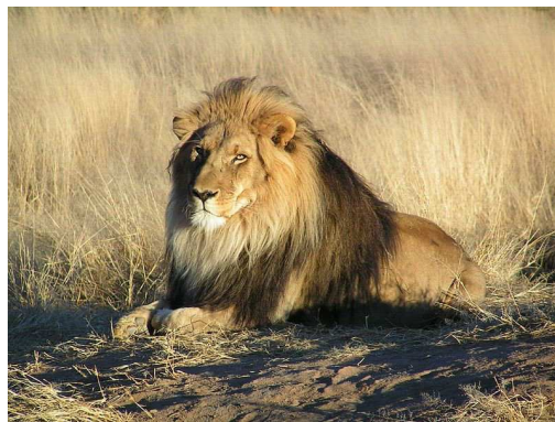
Lion Auteur : Yaaaay