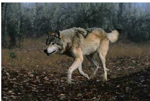
Loup gris commun