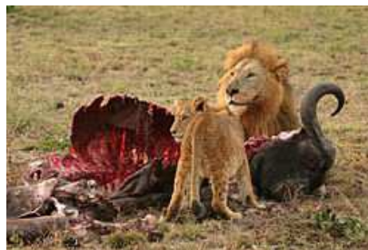
Lion et lionceau dévorant un buffle Auteur : Luca Galuzzi