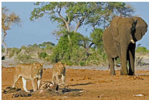
Lionnes et leur proie Auteur : Christophe Aeschlimann