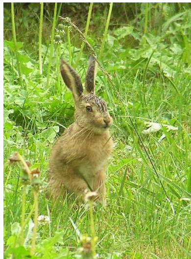
Lièvre Auteur : Jérôme Blondel