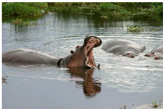
Hippopotame baillant