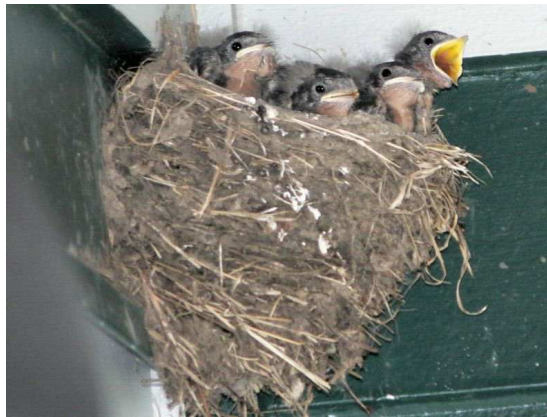
Nid et petits d'hirondelle Auteur : Walter Siegmund