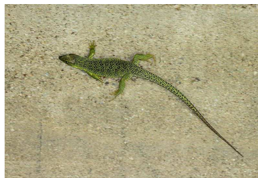
Lézard ocellé Auteur : Philippe Swab