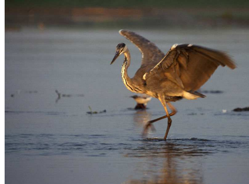
Héron cendré Auteur : Maxwell Hamilton