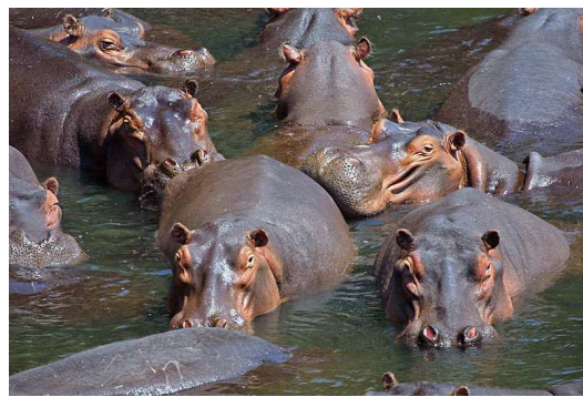
Groupe d'hippopotames Auteur : Paul Maritz