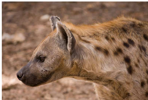
Hyène Auteur : Ikiwaner