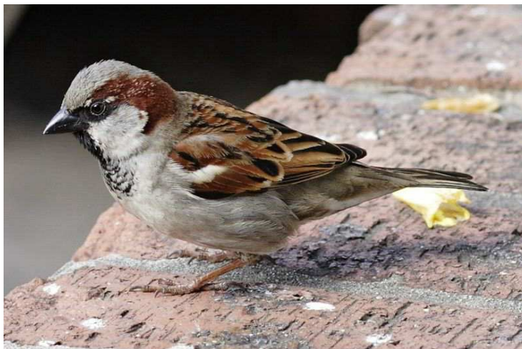
Moineau domestique Auteur : Fir0002 Flagstaffotos.com