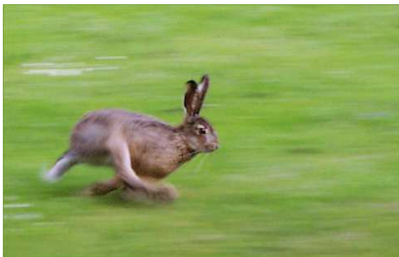
Lièvre en pleine course Auteur : Malene Thyssen