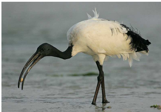
Ibis Auteur : Steve Garvie