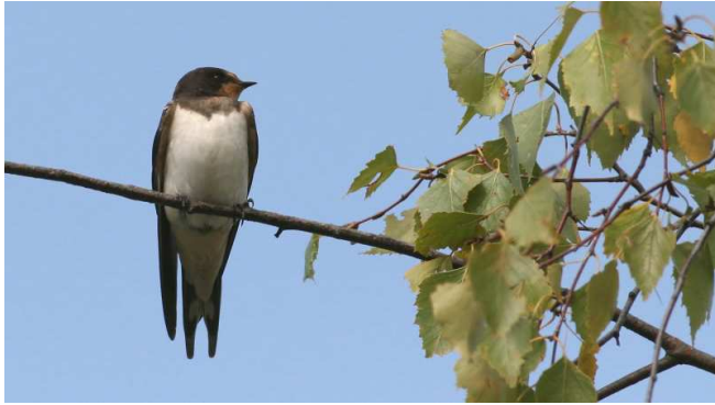
Hirondelle rustique Auteur : Ken Bellington

Taille : jusqu'à 19 cm Poids : 16 à 22 g Envergure : jusqu'à 34 cm Plumage bleu sombre de la tête à la queue, dessous blanc, gorge et pourtour du bec rouges Queue très effilée aux 2 extrémités