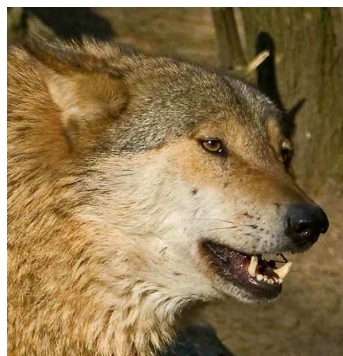
Crocs du loup