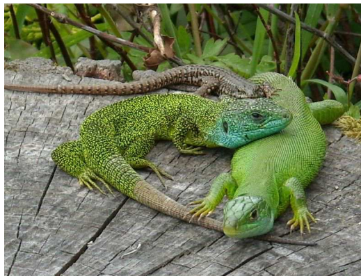
Deux lézards verts et un lézard des murailles