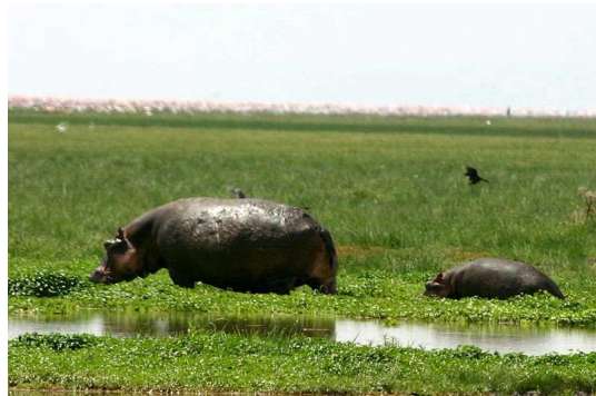
Hippopotame et son petit