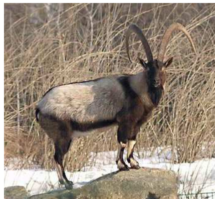
Chèvre sauvage Auteur F. Spangenberg