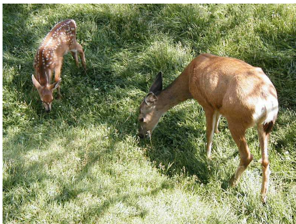
Biche et son faon Auteur :Guillaume Paumier