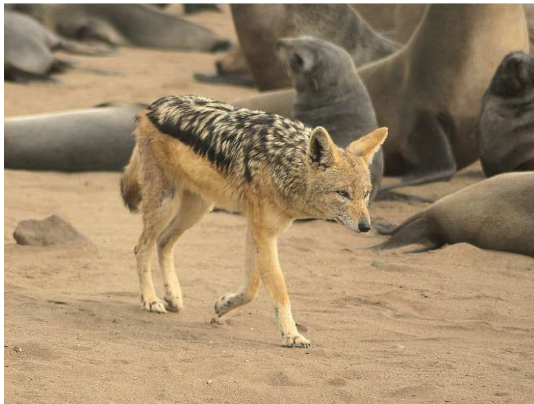
Chacal sur plage en Namibie