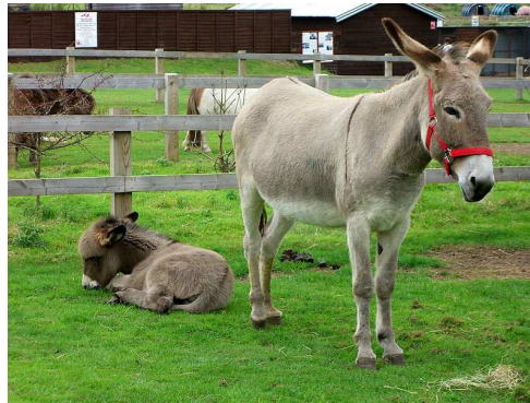
Ane domestique et ânon Auteur : Dave Crosby

En Orient, animal vigoureux, vif, infatigable (très apprécié en montagne), facile à nourrir Utilité : transport de charges, tournage de meule, traction de charrue, monture