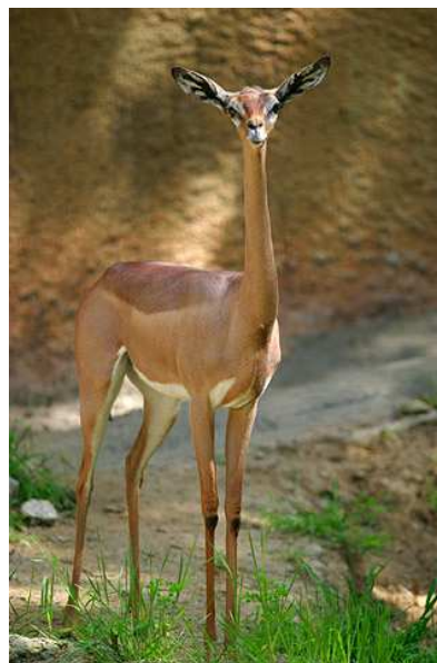
Gazelle de Waller ou gazelle girafe Auteur : Aaron Logan