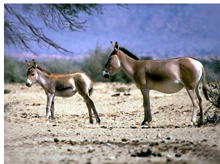
Ane sauvage d'Asie Auteur : Tiarescott

Surpasse celui d'Orient par sa beauté, sa taille, sa vitesse Vit uniquement dans les déserts montagneux Indomptable, ne se laisse pas approcher par l'homme L'onagre est un âne sauvage de grande taille