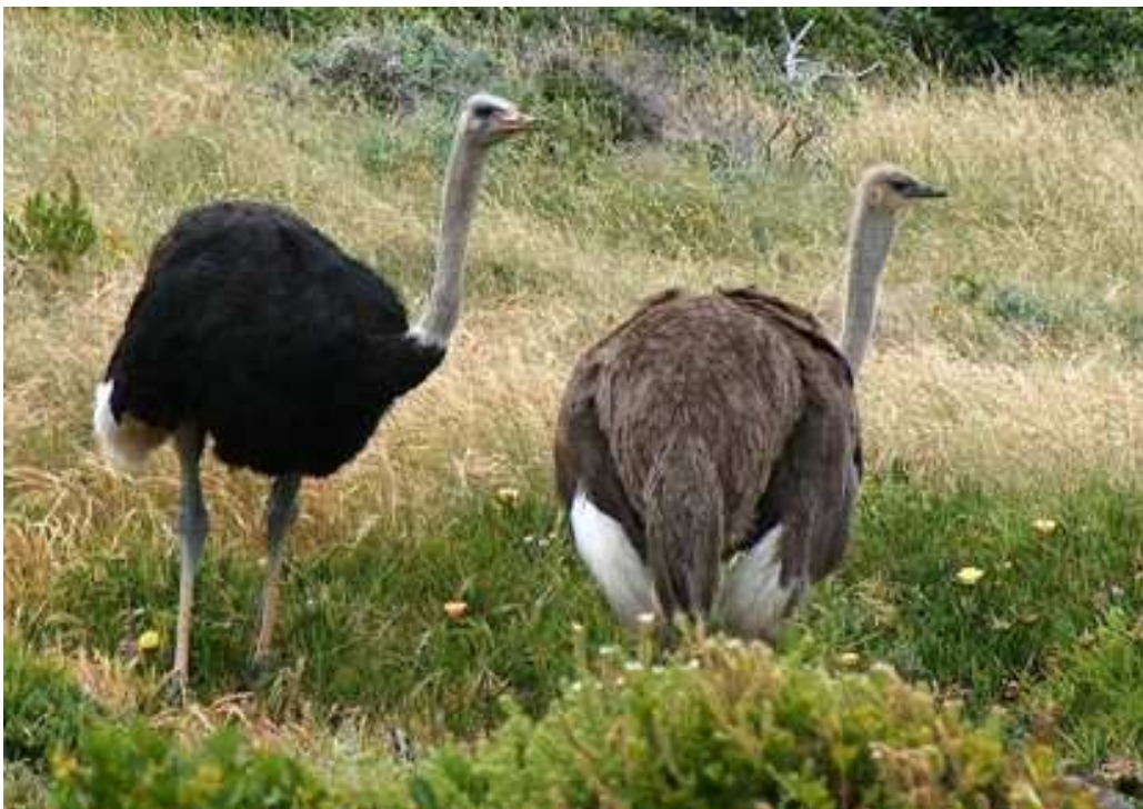
Autruches mâle et femelle