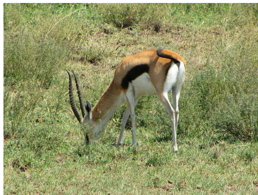
Gazelle de Thompson

NOTE : La différence entre antilope et gazelle est difficile à établir visuellement bien que cette différence existe du point de vue zoologique