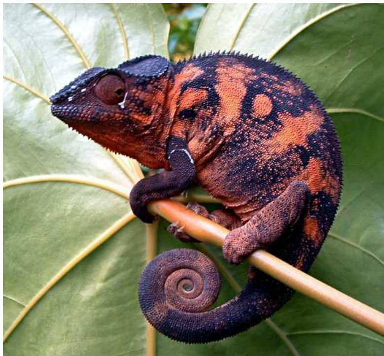
Caméléon panthère Auteur : Anne 97432