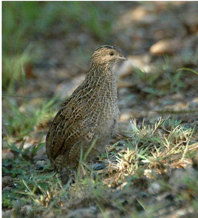
Caille tasmane Auteur : Aviceda

Note : Dans le Sinaï, pendant la migration, il y a des vols importants à 1 à 2 mètres du sol à la faveur du vent. Mais si le vent change, les cailles épuisées tombent et sont faciles à saisir.