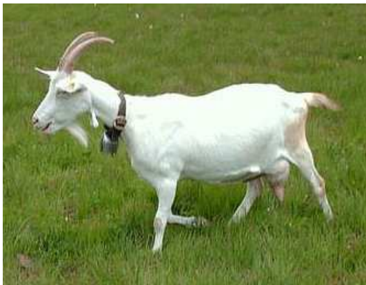
Chèvre Auteur : Irmgard