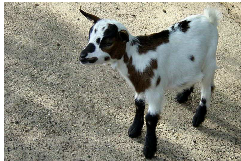
Chevreau Auteur : Lionel Rich