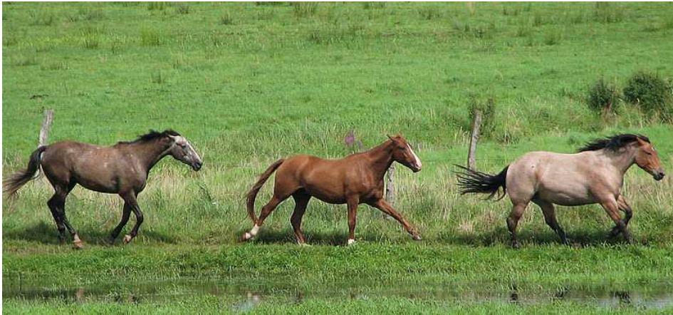
Chevaux au galop Auteur : Darkone