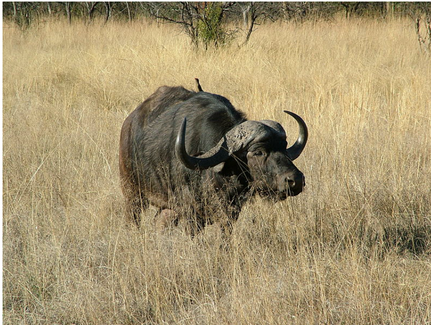
Buffle d'Afrique Auteur : Albert Battle