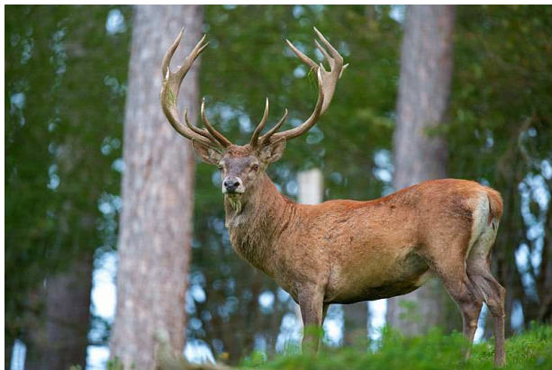
Cerf Auteur : Luc Viatour