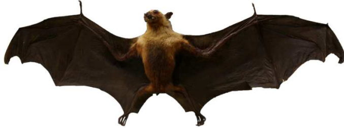
Chauve-souris en vol Auteur : Antoine Motte dit Falisse