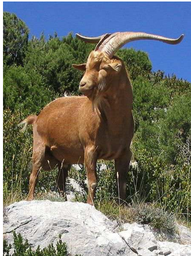
Bouc Auteur : Dirk Beyer