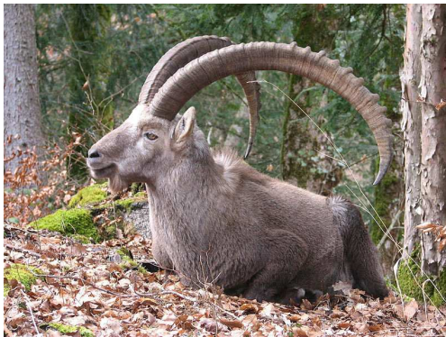
Bouquetin mâle couché