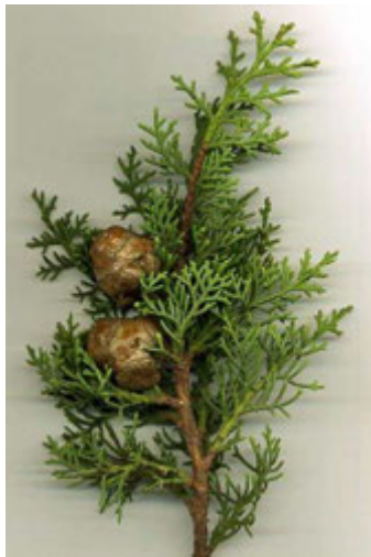
Rameau de cyprès et ses fruits