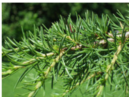
Aiguilles de cèdre