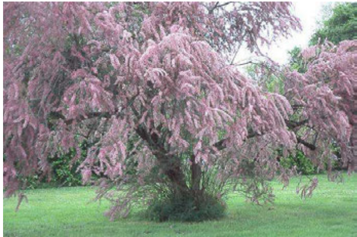
Tamaris en fleur