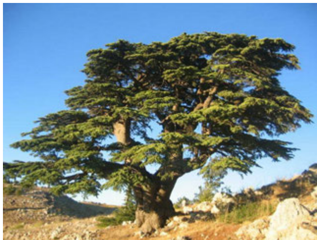
Cèdre du Liban Auteur : Olivier Bèzes