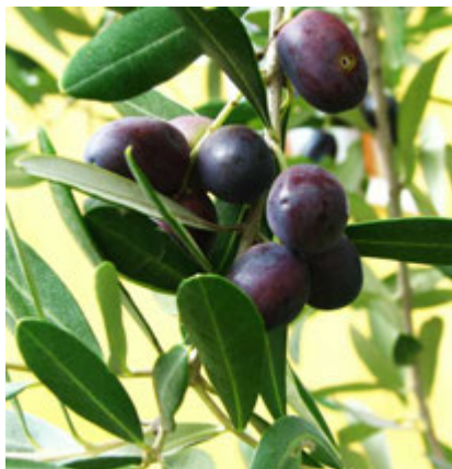
Feuilles d'olivier et olives mûres