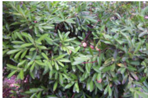
Feuilles de Buis ( buxus longifolia )