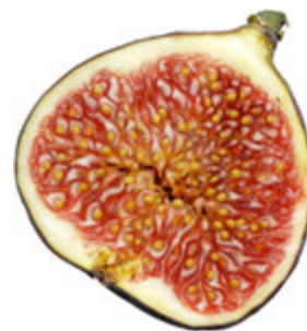
Coupe de figue