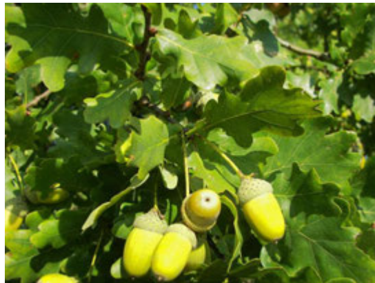
Feuilles et glands de chêne pédonculé