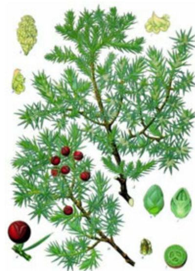
Planche botanique de genévrier cade