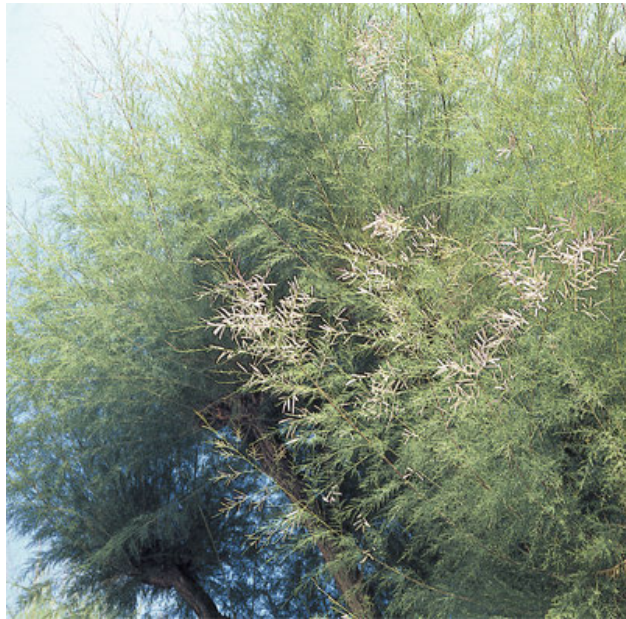
Feuilles de tamaris