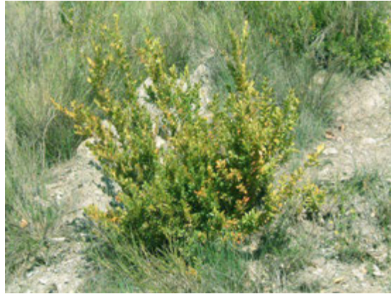
Buis commun ( buxus sempervirens )