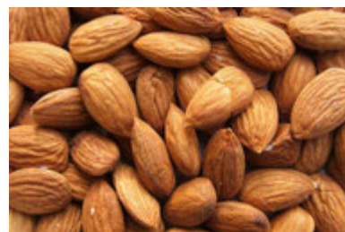
Amandes Auteur : Luigi Chiesa