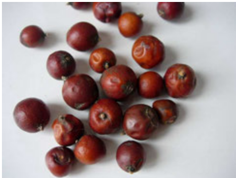
Baies de genévrier cade