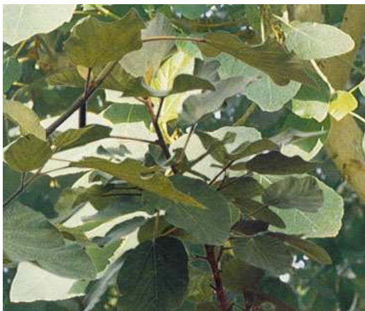
Feuilles de figuier sycomore