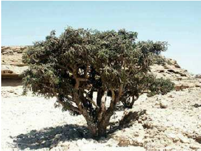
Arbre à encens - Boswellia sacra

La résine est récoltée par incision du tronc et des branches en retirant une bande d'écorce. La sève laiteuse qui coagule à l'air est ramassée à la main