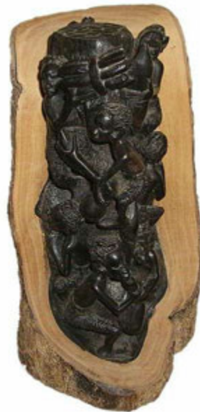
Sculpture sur ébène Auteur : Mistermatt