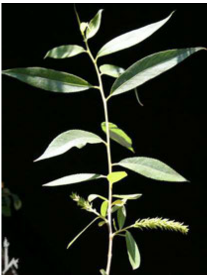
rameau et feuilles