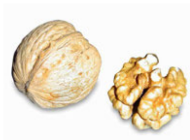
Noix et cerneau Auteur : Horst Frank