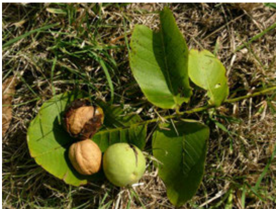
Noix à différents stades