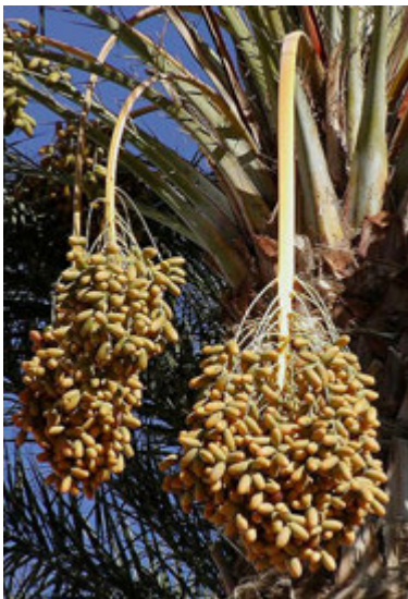
Régimes de dattes