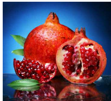
Grenade et ses grains