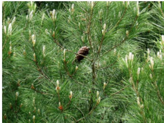
Aiguille et cônes