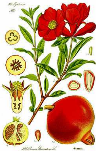
Planche du grenadier