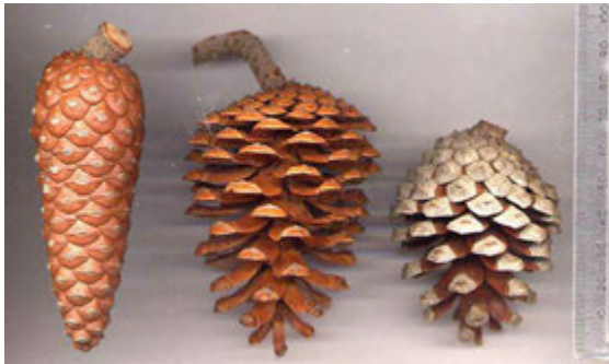
Cônes de pin d'Alep