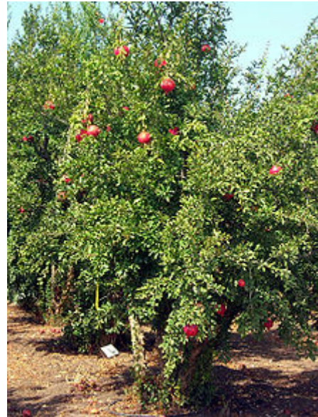
Grenadiers en Israël