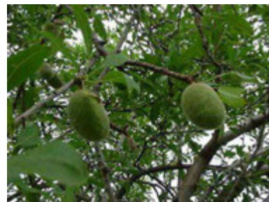
Fruits de l'amandier