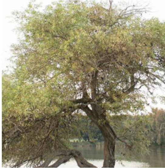
Saule Salix acmophylla