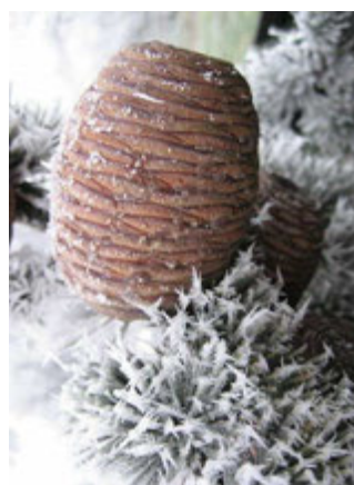
Cône du cèdre