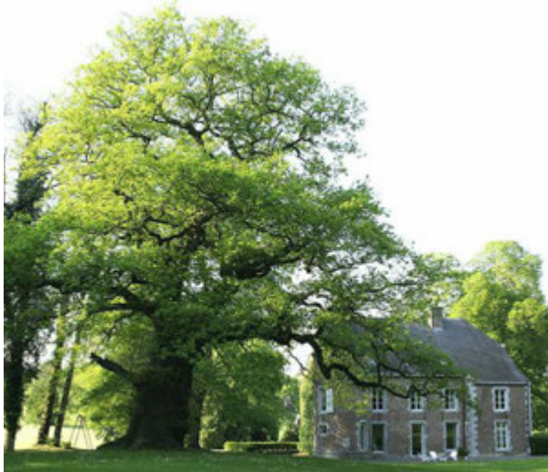
Chêne pédonculé 600 ans Auteur : Jean-Pol Grandmont