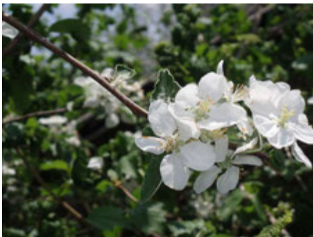
Fleurs de pommier