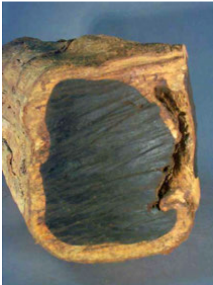
Troc d'ébénier en coupe Auteur : Oboe Cruck