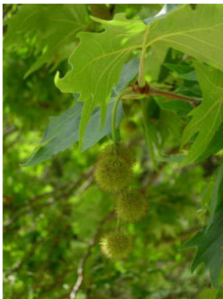
Feuilles et fleurs