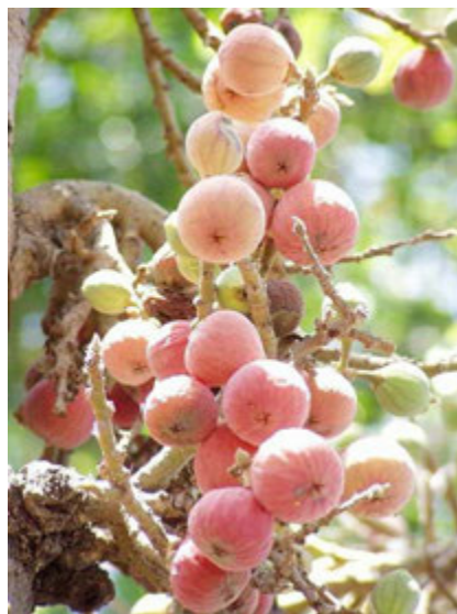
Figues de figuier sycomore