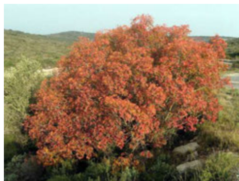
Térébinthe en fleur